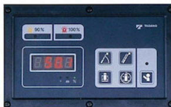
AMC (過負荷防止装置、作業範囲規制装置)